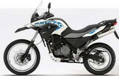
Auraweiss uni/Arroyoblaau uni

G 650 GS Sertão: Opstappen en doorrijden. De G 650 GS Sertão laat zich, dankzij de aluminium motorbeschermpaat, handprotectoren en spaakwielen, door niks tegenhouden.