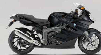
Saphirschwarz metallic/Darkgraphit metallic