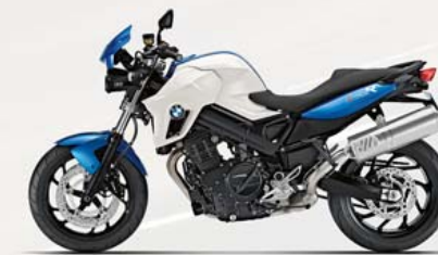
Racingblue metallic/Alpinweiss uni