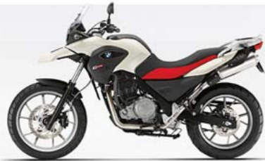
Auraweiss uni, buddy zwart/rood