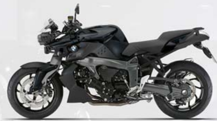
Saphirschwarz metallic/Schwarz seidenglänzend