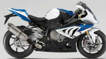
Lightwhite uni/Racing Blue metallic/Saphirschwarz metallic