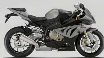
Granitgrau metallic matt