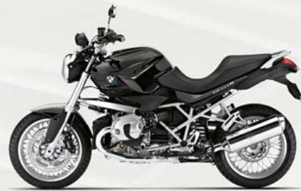
R 1200 R Classic Saphirschwarz metallic met handgeschilderde belijning Alpinweiss uni