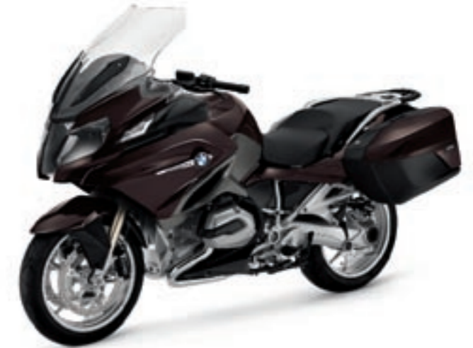
Lakkleur Platinbronz metallic N97 / buddyseat zwart / motorspoiler Schwarz seidenglänzend / tankcover Schieferdunkel metallic matt